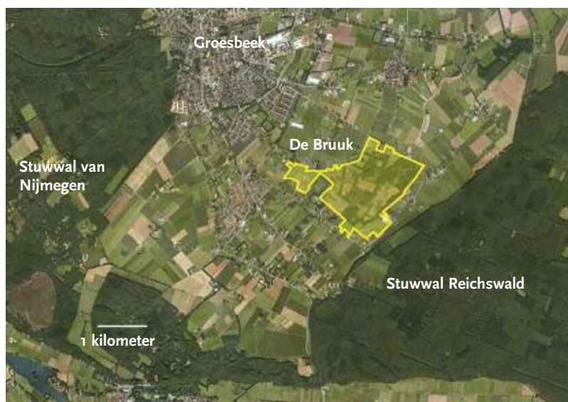
Fig. 1. Begrenzing van Natura 2000 rond het reservaat de Bruuk.

Over de Blauwgraslanden in de Bruuk van vóór de Tweede Wereldoorlog, dus vóór de tijd van de grootschalige ontwateringsmaat-