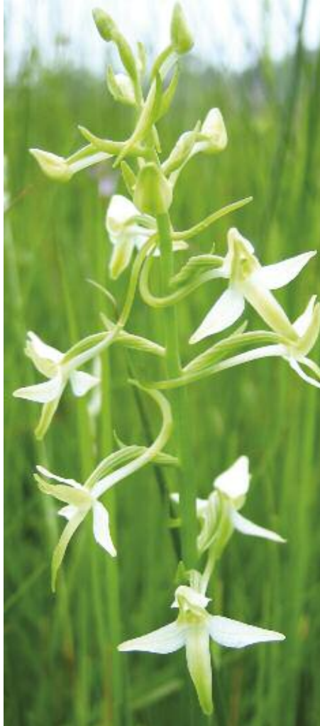
Foto 2. Welriekende nachtorchis in De Bruuk.

kwelwater door tot in de wortelzone, zij het langzaam, waarvan de basenminnende vegetietypen profiteren. Kwel van grondwater trad vroeger over een veel groter areaal op (Streefkerk, 1986). Naast de diepere kwel wordt het gebied gevoed door lokaal, zijdelings toestromend en basenarm grondwater en door regenwater.